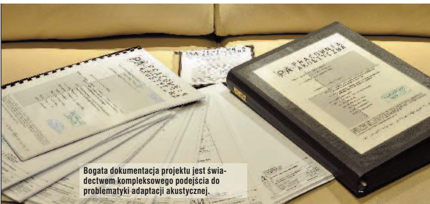
Bogata dokumentacja projektu jest świadectwem kompleksowego podejścia do problematyki adaptacji akustycznej.