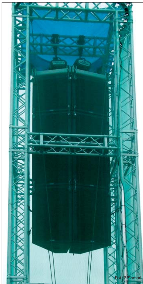
Na system głośnikowy składają się dwie wieże, na których zawieszono są po 4 trójdrożne zestawy dalekiego zasięgu EAW KF 750Fx, 2 trójdrożne zestawy bliskiego zasięgu EAW KF755Fx i po 2 subwoofery EAW SB-750F.