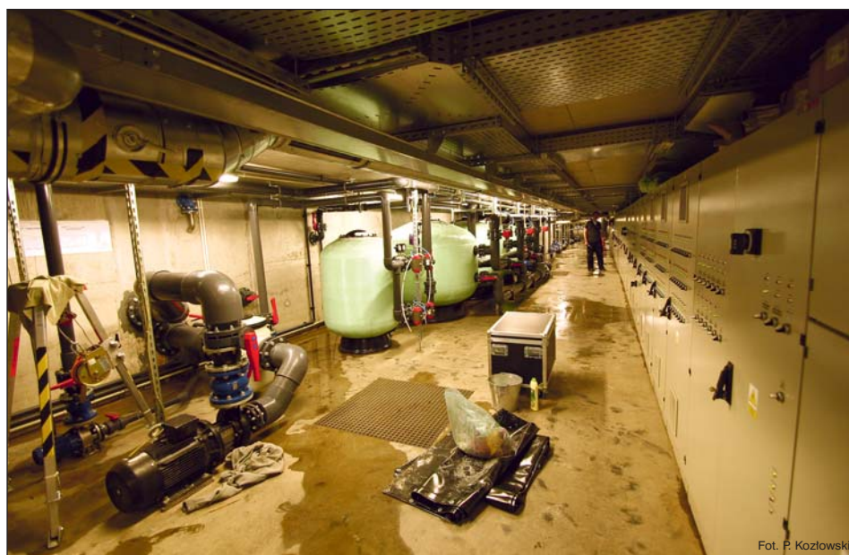
Całość systemu wodnego oraz większość systemu świetlnego i elektroakustycznego jest pod ziemią. Sam wygląd części odpowiedzialnej za odpowiednie przystosowanie wody przypomina wnętrze małej elektrowni wodnej.