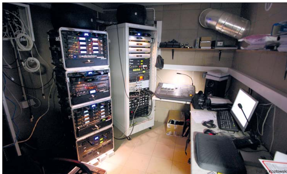
Praktycznie całość systemu, oprócz wzmacniaczy i głośników, zamknięta jest w osobnym pomieszczeniu, z którego można również sterować całym pokazem.