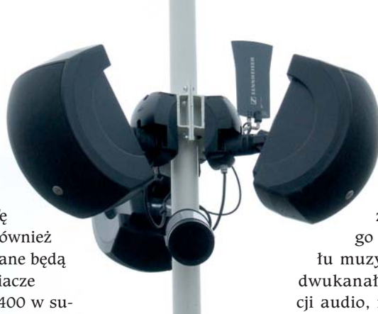
36 dwudrożnych zestawów EAW SMS 4124 o mocy 128 W zamontowane jest na latarniach (po 3 na 12 latarniach).

w pomieszczeniu technicznym, która może służyć do dodatkowego odtwarzania sygnału muzycznego w formacie dwukanałowym lub rejestracji audio, również w formacie dwukanałowym,